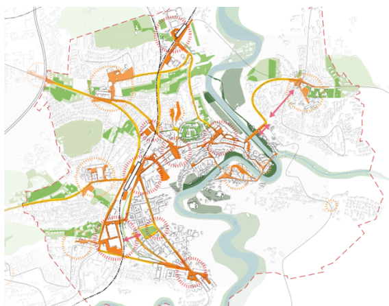
Plan Güller & Güller

La complexité du dossier est due à la difficulté de communication des projets stratégiques à long terme pour le public non spécialisé, ainsi qu'à la délicate sensibilisation des acteurs politiques qui n'ont pas participé à l'entier des démarches de conception. Le choix des termes (compréhensibles par tous), ainsi que la démonstration de l'importance et la pertinence des décisions prises est alors essentielle.